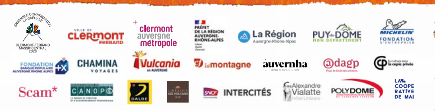
Illustration principale : Véro Béné | Graphisme : Jean-Louis Massardier